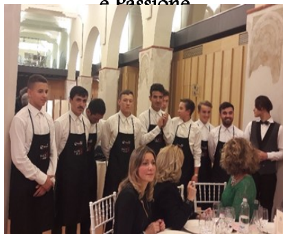
Cena benefica Club Tecnologia e Passione