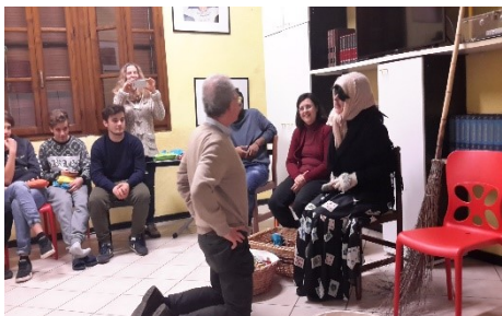
La Befana del Villaggio