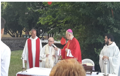
Cresima al Villaggio