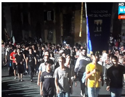
Processione di Santa Croce