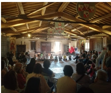
Evento su Don Milani