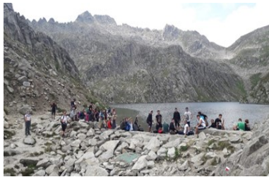
Vacanze in Trentino